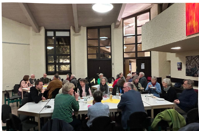
amh Foto: amh

Die Impulse der drei Abende wurden anschließend bei einem gemeinsamen Abendessen noch einmal aufgenommen und die Reihe endete mit guten und angeregten Gesprächen.