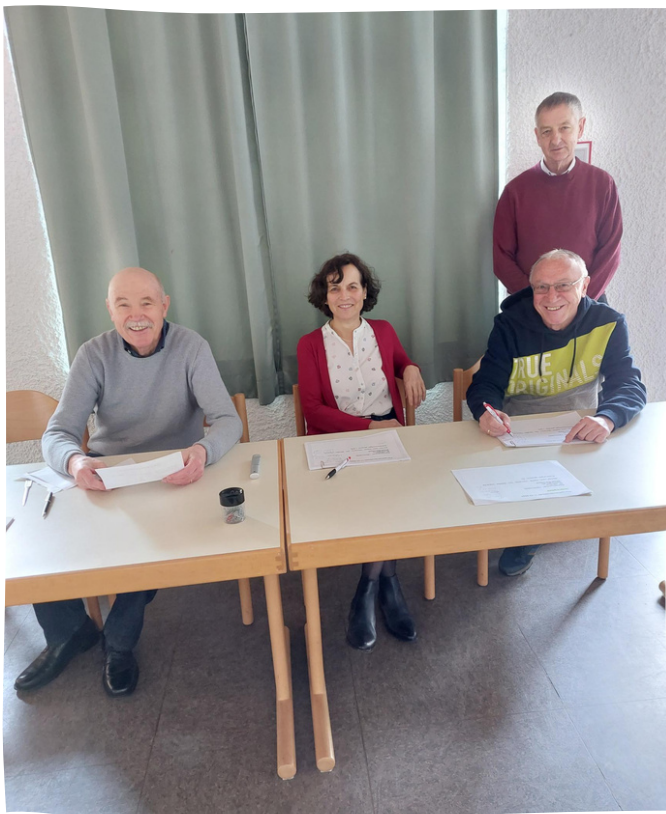
Der Wahlvorstand

Franziskussal im Ökumenischen Gemeindezentrum